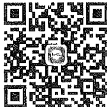
QR Code เข้าร่วมกลุ่มไลน์