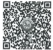
QR Code แบบสำรวจฯ

สำนักบริหารการคลังท้องถิ่น กลุ่มงานนโยบายการคลังและพัฒนารายได้ โทร. ๐-๒๒๔๑-๙๐๐๐ ต่อ ๑๔๒๖-๓๑ โทรสาร ๐-๒๒๔๑-๘๘๙๘